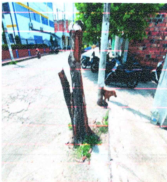
Figura 1, 2,3,4. Imágenes de las raíces del árbol antes de ser intervenido en el 2024.